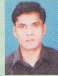
Yasser arafat F. A. (Tamilnadu)